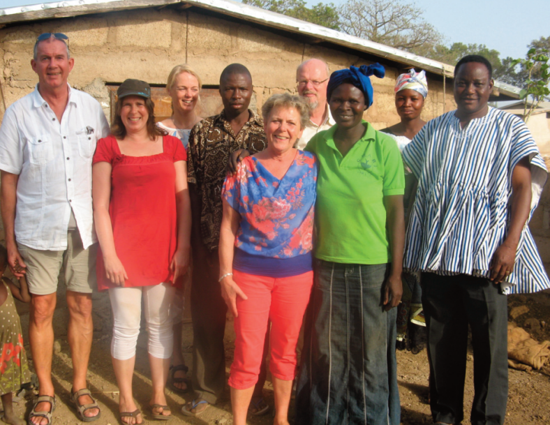
Ons laatste bezoek was in 2014